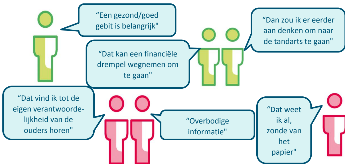
Figuur 2 Waarom stellen ouders advies van de zorgverzekeraar al dan niet op prijs (quotes)?

* Voorbeelden van antwoorden die hier werden genoemd zijn "Alles is eenvoudig terug te vinden. Daarnaast is de zorg dermate belangrijk dat deze kosten geen probleem zouden moeten zijn (mogelijk wel voor minder bedeelden!)", "krijg al post genoeg", "niet nodig", "Omdat ze dan wel weer wat anders bedenken wat wel kosten meebrengt zoals mondhygiëniste of beugels"