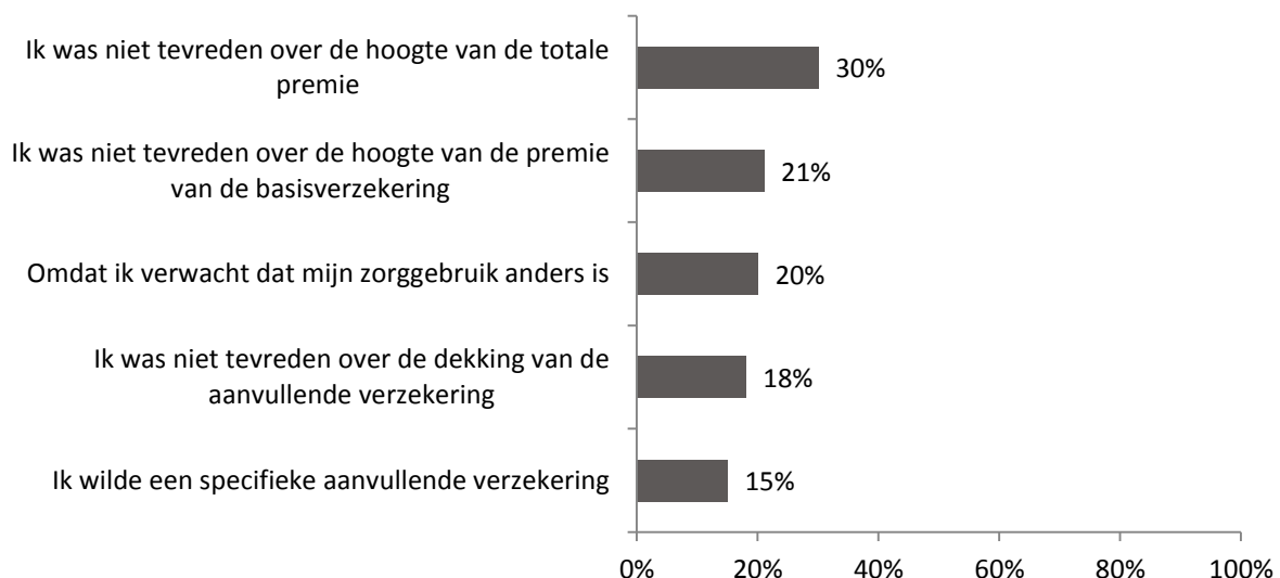
Figuur 2: Top 5 meest genoemde redenen om over te stappen naar een andere zorgverzekeraar (n=61)

Net als in voorgaande jaren is ook in 2021 de hoogte van de totale premie de meest genoemde reden om over te stappen naar een andere zorgverzekeraar C . Drie op de tien (30%) overstappers gaf aan hier ontevreden over te zijn (Figuur 2). Ontevredenheid over de hoogte van de basispremie werd dit jaar door 21% van de overstappers als reden genoemd. In 2019 en 2020 lag dit percentage lager (respectievelijk 9% en 11%). De verwachting dat het zorggebruik het komende jaar anders is, werd door één op de vijf overstappers in 2021 als reden genoemd. Ook de aanvullende verzekering speelde bij een deel van de verzekerden een rol in hun keuze om over te stappen. 18% van de overstappers gaf dit jaar aan ontevreden te zijn over de dekking van de aanvullende verzekering en 15% had de wens om een specifieke aanvullende verzekering te nemen.