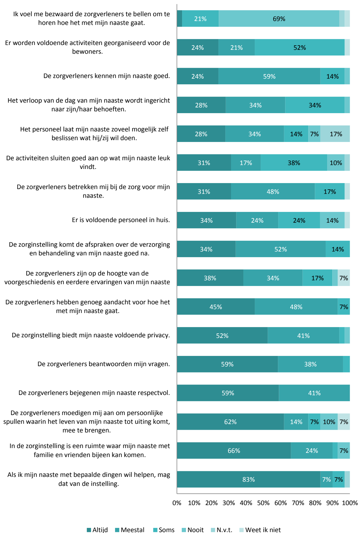
Figuur 3 Ervaringen met de zorg in een zorginstelling*