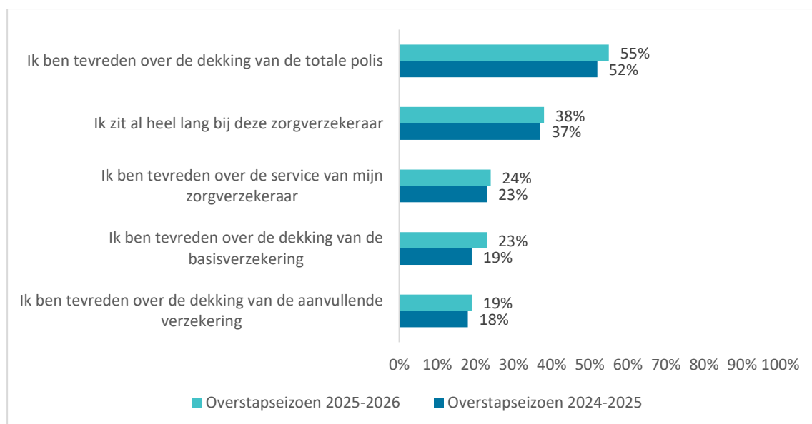
Figuur 3 Top 5 meest genoemde redenen om bij de huidige zorgverzekeraar te blijven (n=678) (Respondenten konden meerdere redenen aankruisen)

Figuur 3 toont de top vijf meest genoemde redenen om bij de huidige zorgverzekeraar te blijven in het overstapseizoen 2025-2026. Er zijn weinig verschillen te zien in de huidige top vijf ten opzichte van voorgaande jaren E . Ruim de helft (55%) van de niet-overstappers geeft aan bij de huidige zorgverzekeraar te blijven, omdat ze tevreden zijn over de dekking van de totale polis. Dit is, net als in vorige overstapseizoenen, de meest genoemde reden om niet over te stappen 1-9 . 'Ik zit al heel lang bij deze zorgverzekeraar' staat net als vorig jaar op de tweede plaats van genoemde redenen om bij de huidige zorgverzekeraar te blijven. Als nieuwkomer staat de genoemde reden 'Ik ben tevreden over de dekking van de aanvullende verzekering' nu op nummer vijf (19%). Deze reden stond het jaar ervoor op nummer zes (18%).