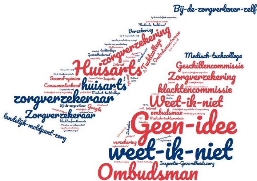
Figuur 3 Waar zou u terecht kunnen met een klacht over de gezondheidszorg?

Alle respondenten werden allereerst open bevraagd naar hun ideeën over bij wie zij terecht zouden kunnen met een klacht over de gezondheidszorg. Deze antwoorden staan weergegeven in figuur 3. Vervolgens werd deze vraag nogmaals gesteld, maar dan met verschillende antwoordcategorieën (tabel 28). Hoewel het antwoord ‘bij de zorgverlener zelf’ in beide gevallen veelvuldig voorkomt, is het bij de open bevraging (figuur 1) opvallend dat een groot deel van de respondenten aangeeft het niet te weten (antwoordcategorieën “geen idee” en “weet ik niet”).